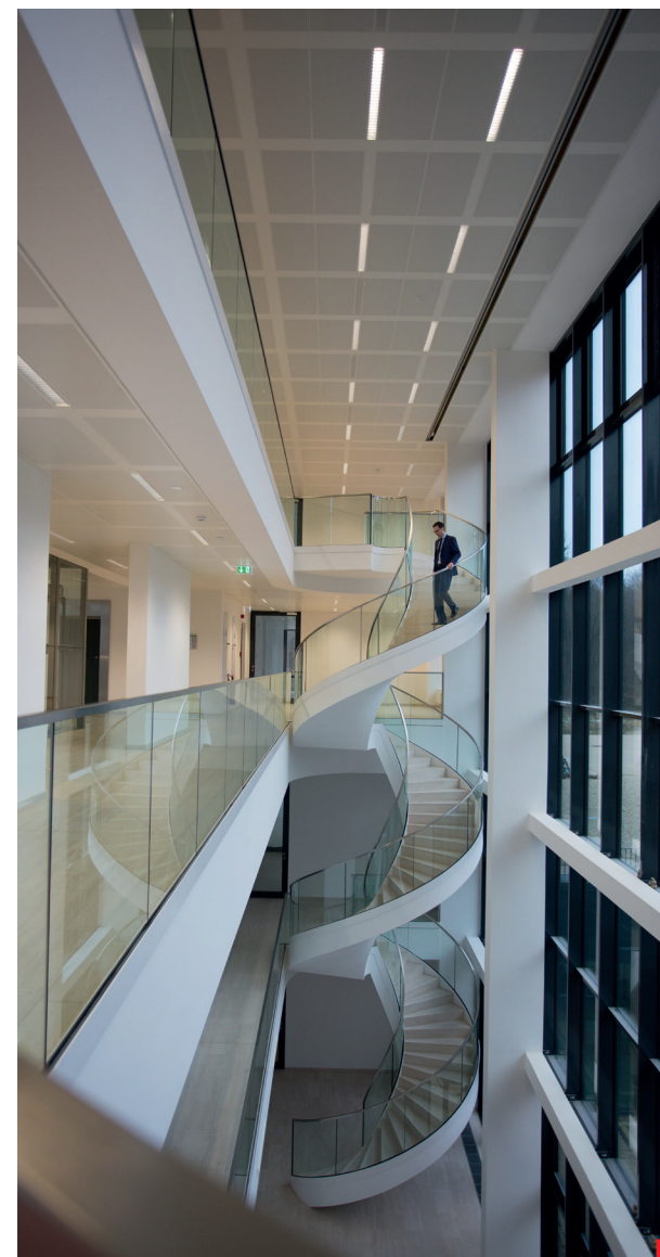
4 Espace réception.