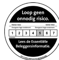
*De risico-indicator is berekend met behulp van de representatieve unit klasse A USD*

Bedachtzame beleggers die op zoek zijn naar een gediversifieerde blootstelling aan ontwikkelde markten in Noord-Amerika, Europa en Azië, waarbij tegelijkertijd wordt voldaan aan criteria op het gebied van milieu, maatschappij en governance. Ontworpen voor institutionele beleggers waaronder: multinationals, pensioenfondsen, verzekeringsmaatschappijen, staatsinvesteringsfondsen, non-profit organisaties en subadviseurs.